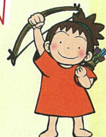
縄文の森キャラクター じょうもんくん