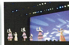
※写真は過去のイベントの様子です