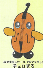
みやまコンセール PRマスコット チェロまるも